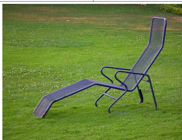
Freizeitausgleich für Bereitschaftszeit an einem vom Arbeitgeber bestimmten Ort, der dann nach eigenen Wünschen gestaltet werden kann, z.B. im Liegestuhl im Luisenpark

Die DPoIG beabsichtigt politisch darauf hinzuwirken, dass der Dienstherr auf die Einrede der Verjährung verzichtet, um Massenverfahren möglichst zu vermeiden. Unabhängig davon, ist es natürlich jedem Mitglied freigestellt, den gewerkschaftlichen Berufsrechtsschutz in Anspruch zu nehmen und das dbb Dienstleistungszentrum mit der Durchsetzung der Interessen zu beauftragen oder sich von einem „Freien Anwalt“ vertreten zu lassen.